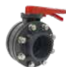
VALVOLA A FARFALLA COMPLETA COMPLETE BUTTERFLY VALVE

Montate con flange, collari, bulloni e guarnizioni Mounted with flanges, collars, bolts and gaskets