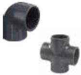
RACCORDI IN PVC-U - GOMITI, CURVE, CROCI